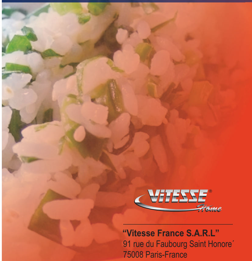
РИС / КРУПЫ ПЛОВ СУП МЯСО ЙОГУРТ ДЕСЕРТ ПАРОВАРКА КАША МУЛЬТИВАРКА РУКОВОДСТВО ПО ЭКСПЛУАТАЦИИ ЗАПЕКАНИЕ МОЛОКО

ПОДСВЕТКА ОТМЕНА 20:00 ОТЛОЖЕННЫЙ СТАРТ ВРЕМЯ